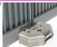
Plot résine octogonal 26Kg