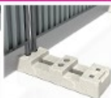
Plot résine trapèze 16Kg