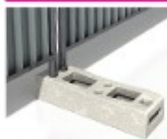
Plot béton 25Kg