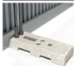
Plot résine palettisable 18Kg