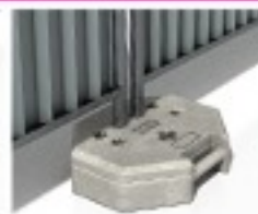
Plot résine octogonal 26Kg