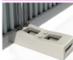
Plot béton 36Kg