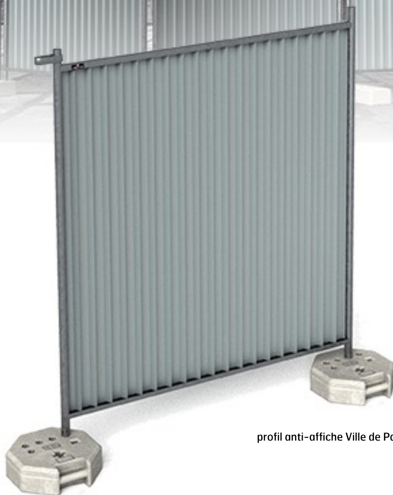
profil anti-affiche Ville de Paris