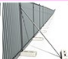
Jambe de force à lester