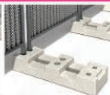
Plot résine trapèze 16Kg