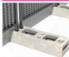
Plot béton 25Kg