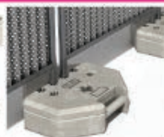
Plot résine octogonal 26Kg