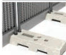
Plot résine palettisable 18Kg